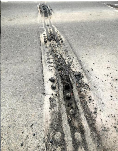
松散、坑槽、积水积尘