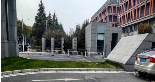
回填冷不料松散麻面